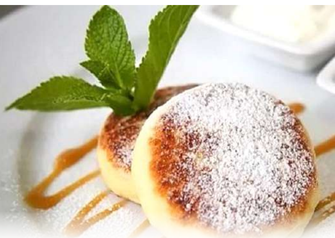
Сырники 2 шт / 140 г 100,-