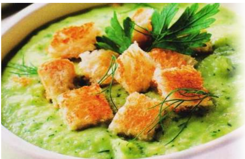
Суп-пюре со шпинатом